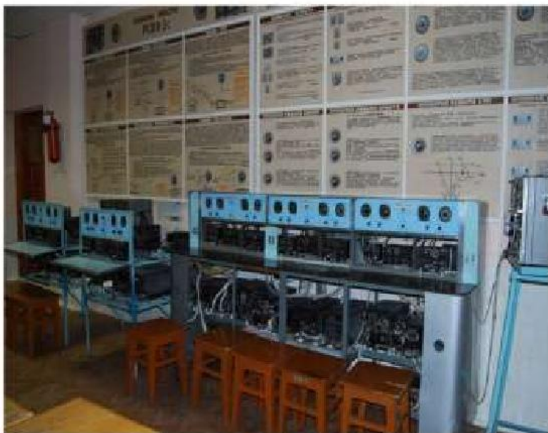
Угломерно-дальномерные радиотехнические системы РДН