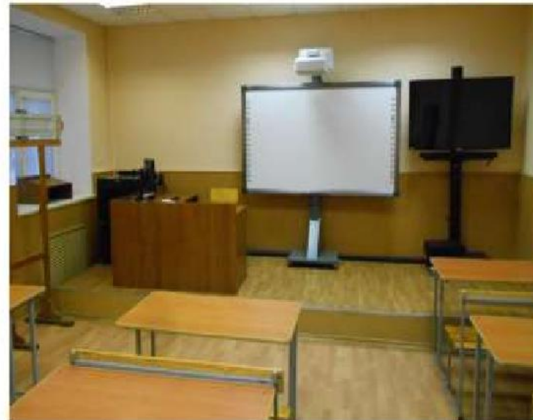
Аудитория фронтовой бомбардировочной авиации