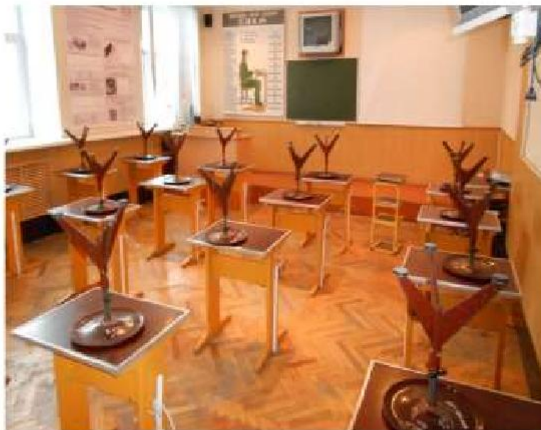
Специализированная аудитория № 428