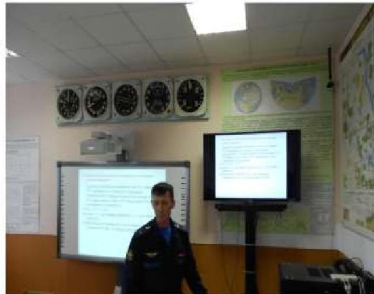
Учебная аудитория № 322