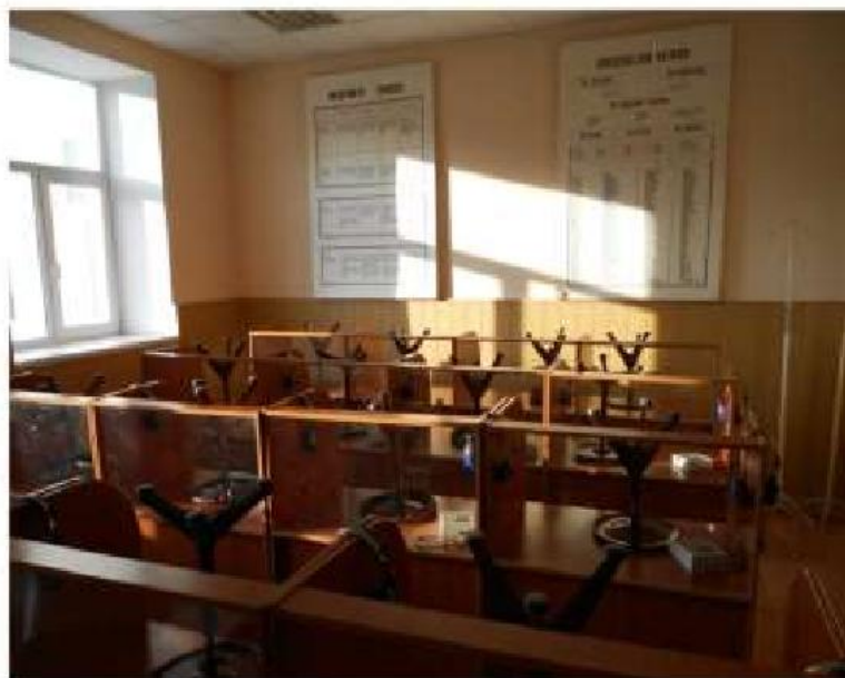
Специализированная аудитория № 328