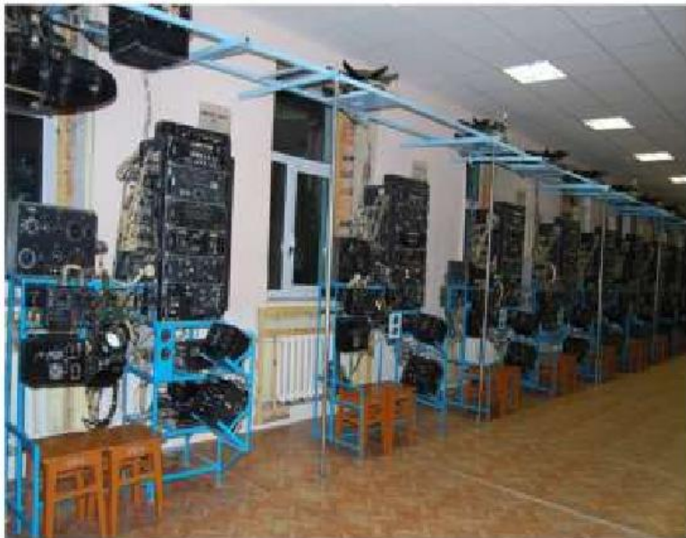
Комплекс радиолокационного оборудования прицела "Рубин-1А"