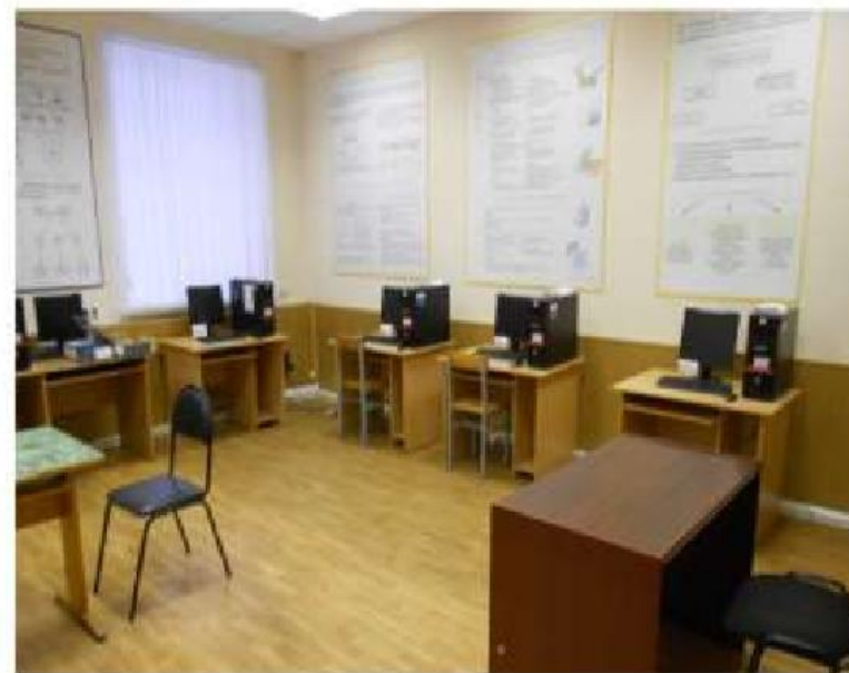
Компьютерный класс № 251