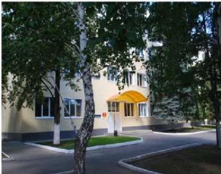
Внешний вид казармы