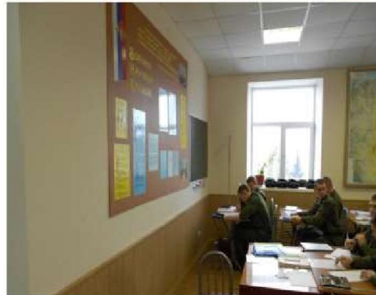
Специализированная аудитория № 437а