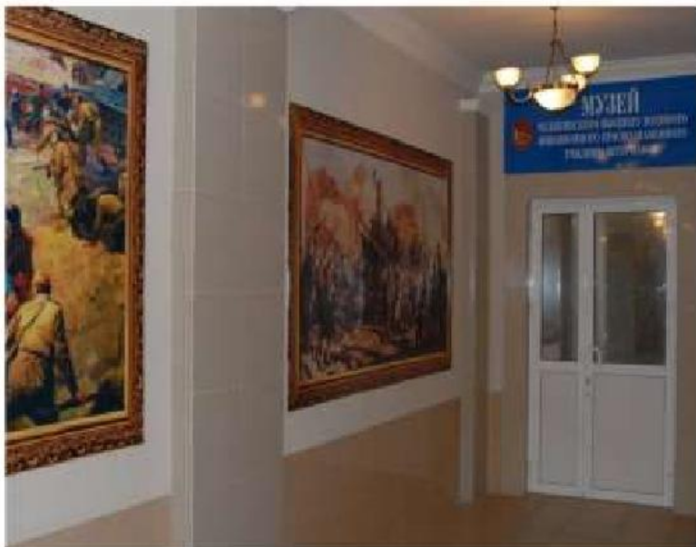
Вход в музей