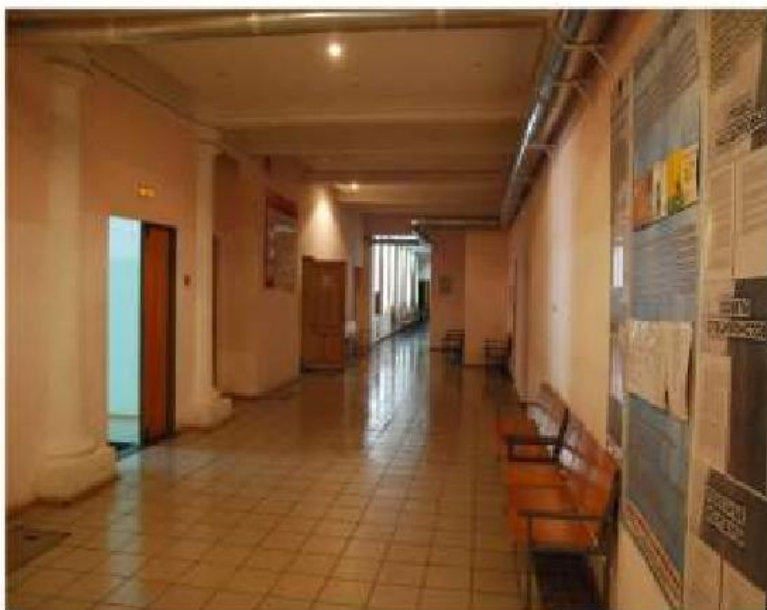
Коридор 1-го этажа