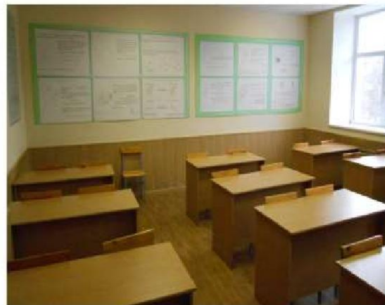
Учебная аудитория № 240