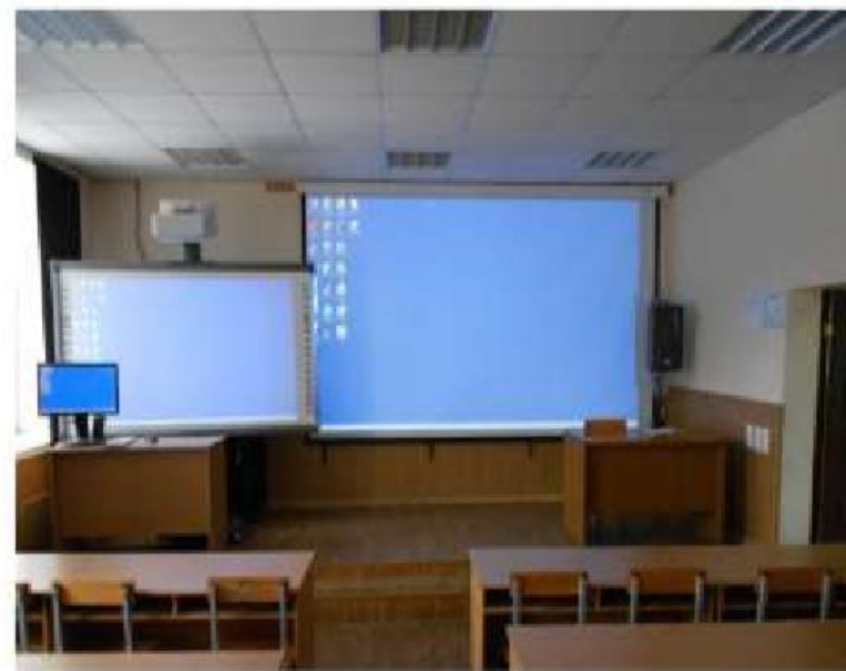
Класс безопасности полетов № 237