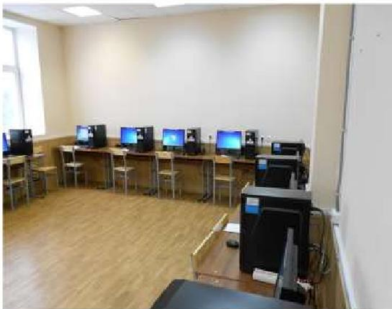
Компьютерный класс № 239