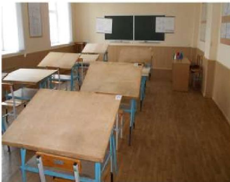
Чертежный зал № 245