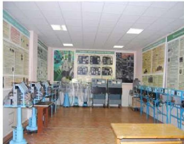
Угломерные радиотехнические системы АРК