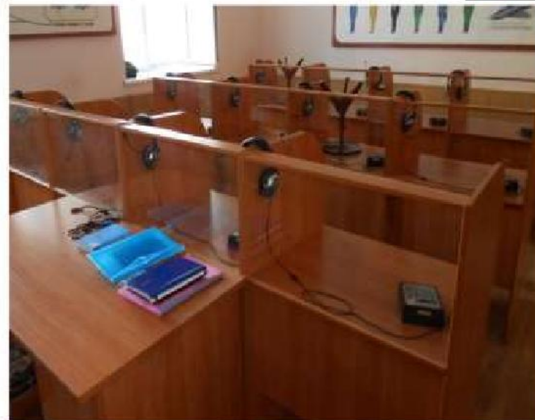
Специализированная аудитория № 352