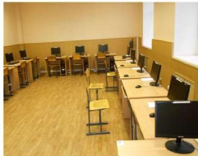
Компьютерный класс № 224