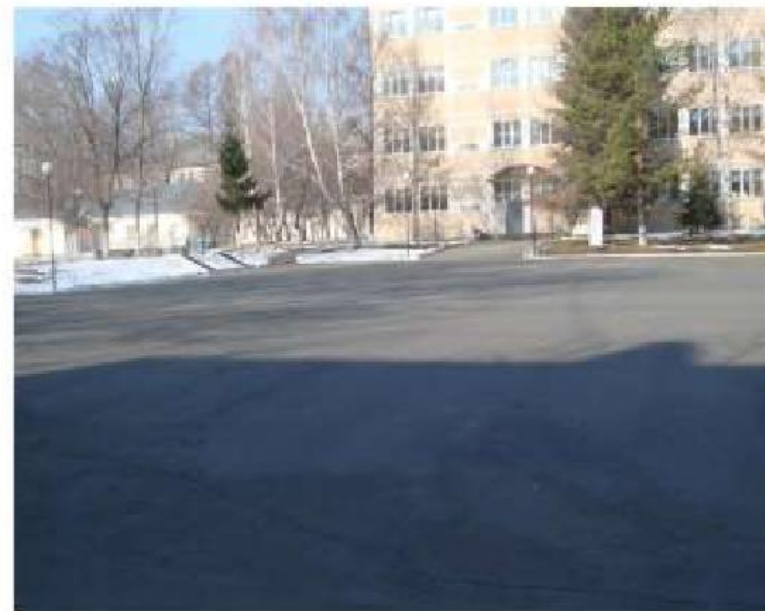
Плац курсантских подразделений