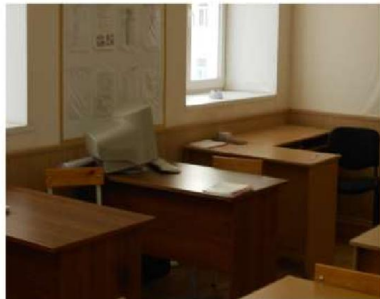
Инструкторская группа (боевого упра № 447