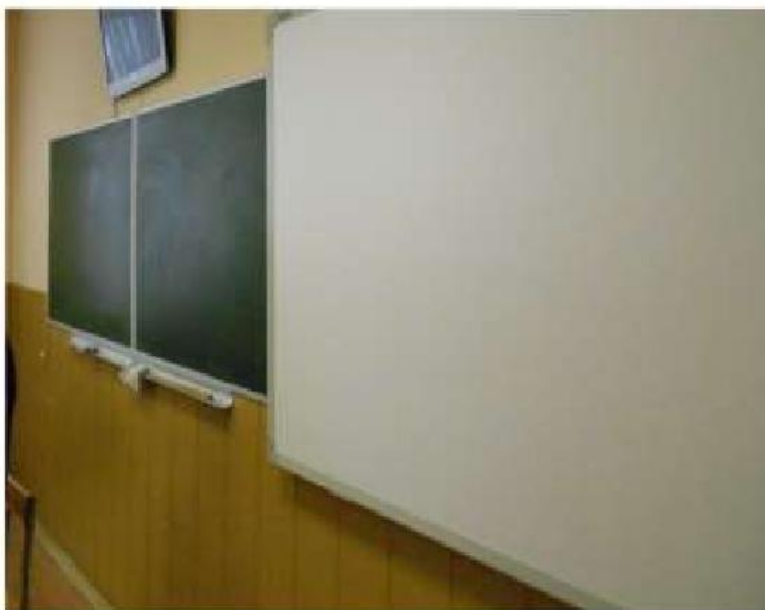
Учебная аудитория № 323