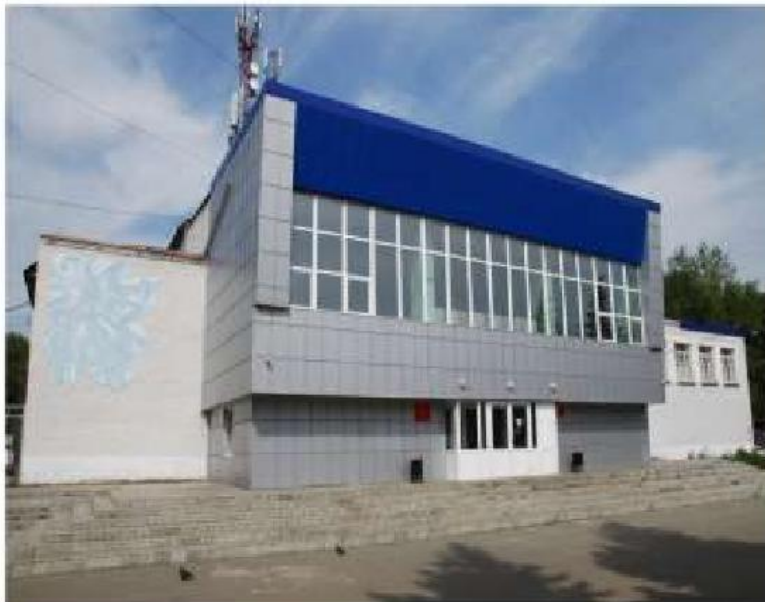
Внешний вид здания