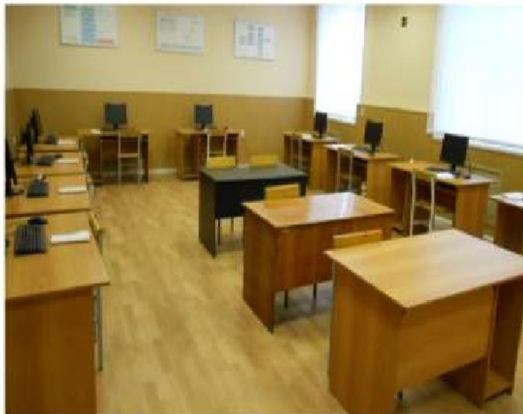
Компьютерный класс № 204