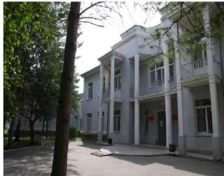
Внешний вид здания