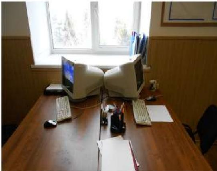
Учебный кабинет (теории управления авиацией)