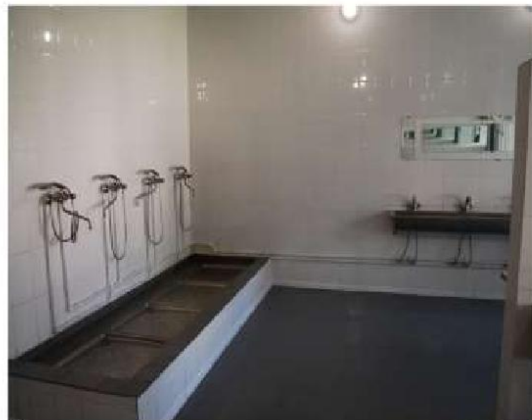
Комната для умывания