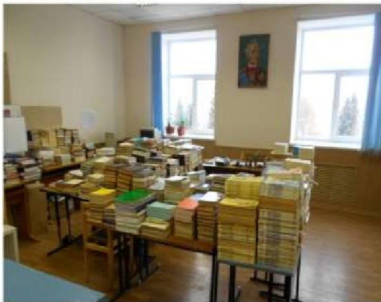
Учебный кабинет № 437