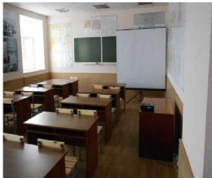
Класс предварительной подготовки летных групп к полетам