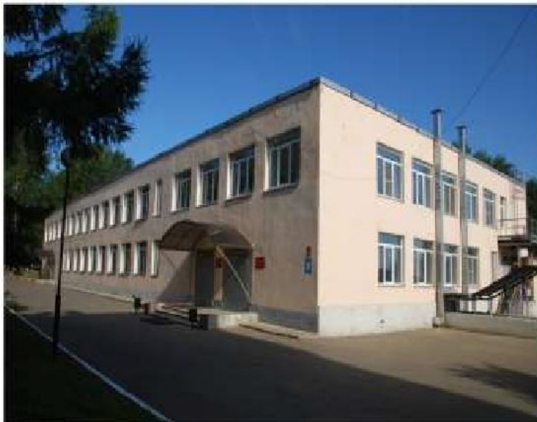
Внешний вид здания