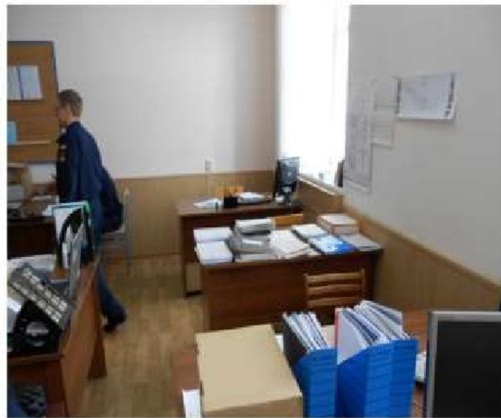
Преподавательская кафедры № 22