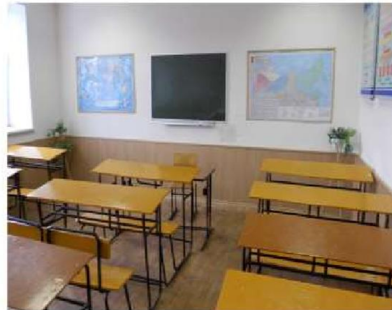
Учебная аудитория № 434