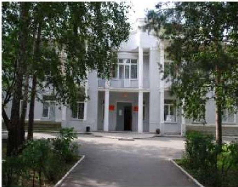
Внешний вид здания