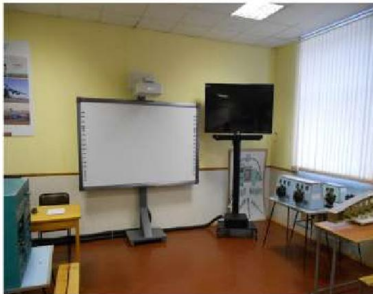
Учебная аудитория № 430