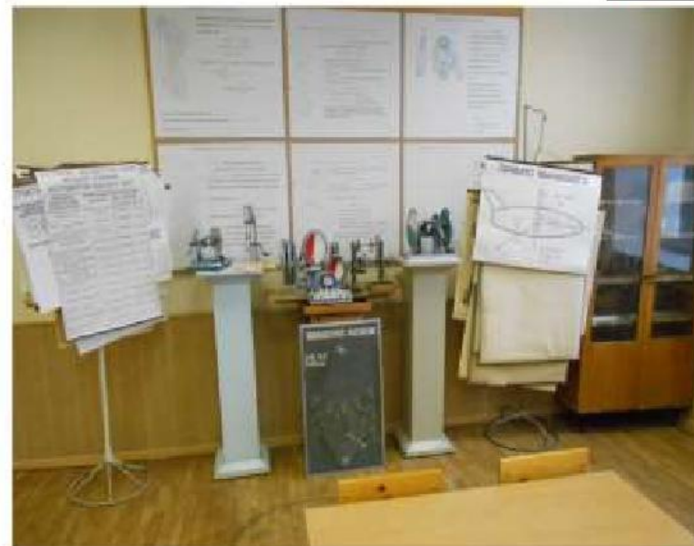
Лаборатория механики № 241