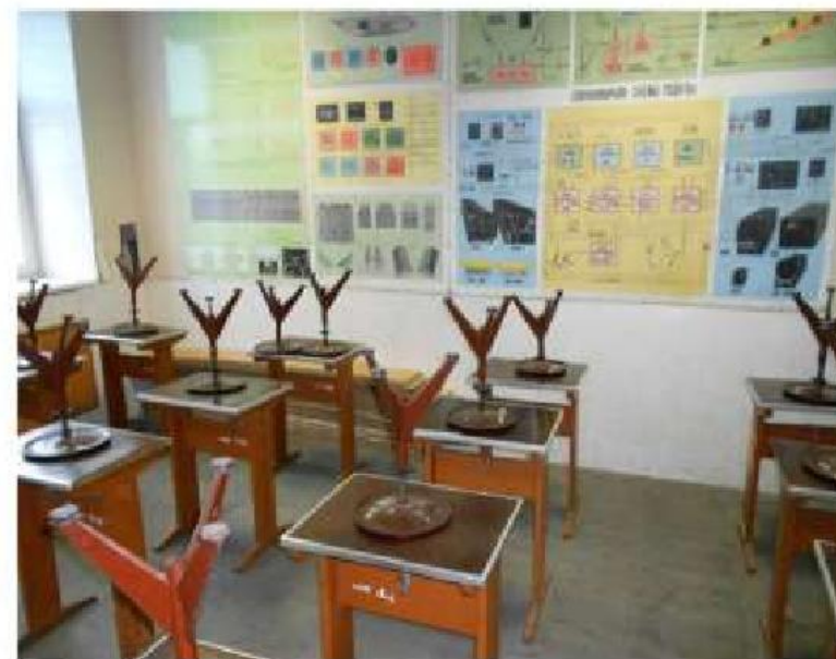
Специализированная аудитория № 4;