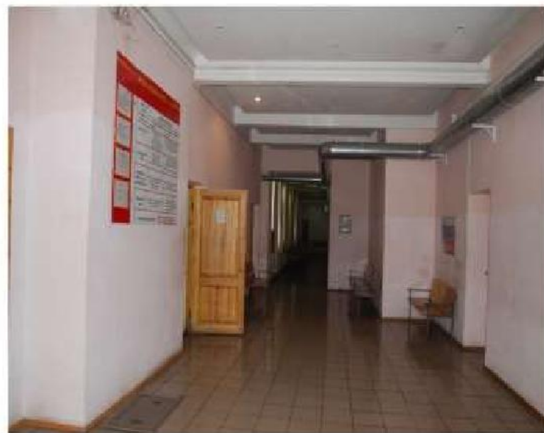
Коридор 2-го этажа