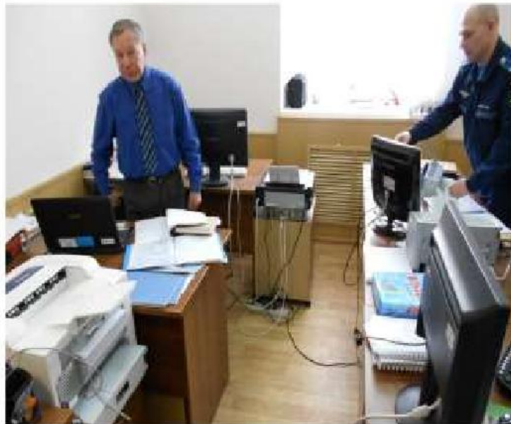
Преподавательская кафедры № 21