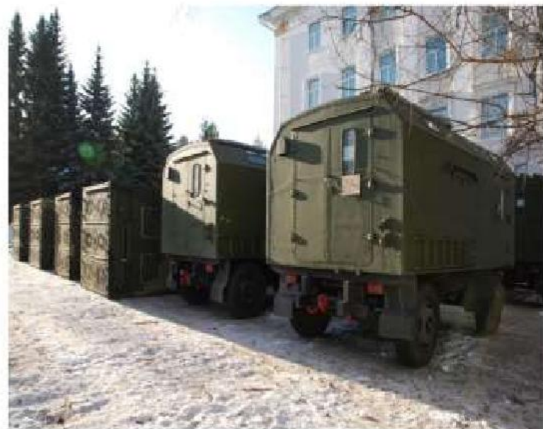
Автоматизированная системы управления с истребительной авиации "Постскриптум"