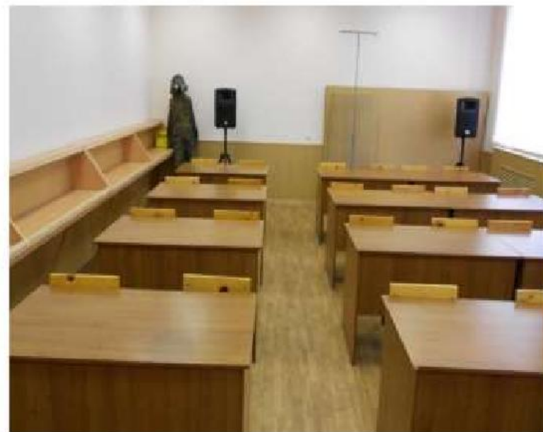
Аудитория РХБ защиты