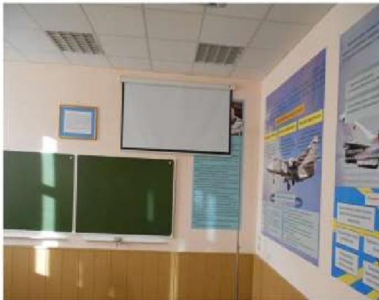
Класс подготовки командира взвода (штурмана корабля)