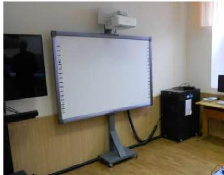
Учебная аудитория № 441