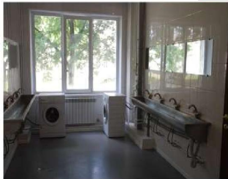
Комната для умывания