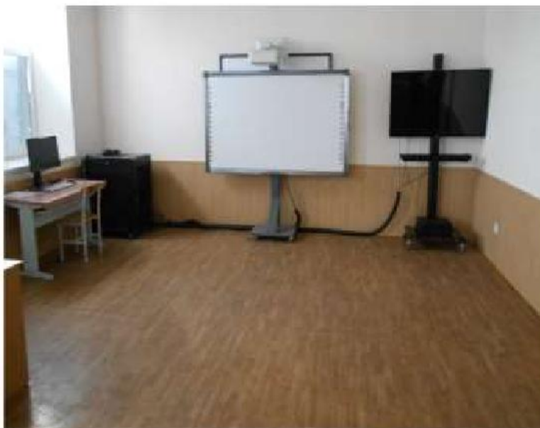
Специализированная аудитория № 446